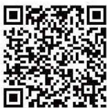
Kitten Dance Planet